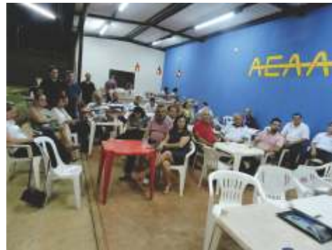
Reunião realizada em Taquaritinga