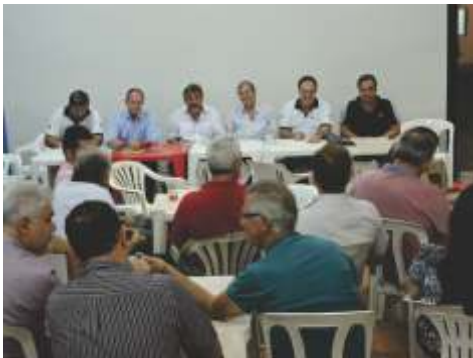
Mesa Diretora dos Trabalhos