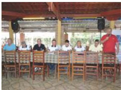
Mesa Diretora dos Trabalhos