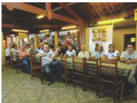
Reunião da UNABAMM