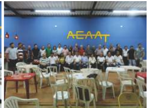
Participantes da reunião