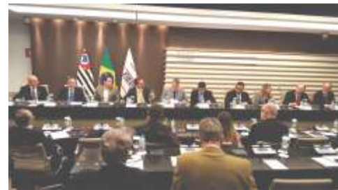
Reunião da FREPEM na Sede da FIESP