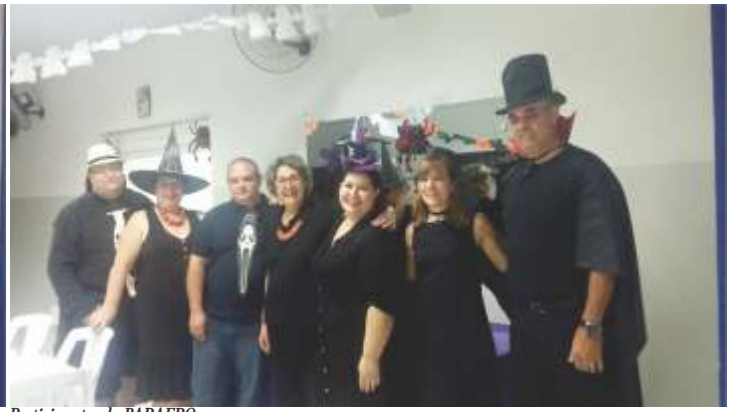
Participantes do BARAERO